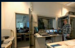
e-learning und Online Konferenz

weitere Informationen unter www.fh-ooow.de