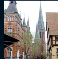
Rathaus und Lambertikirche

Wir sind ein Fachbereich am historischen Innenstadtkern von Oldenburg gelegen. Ein vielfältiges, interessantes Kultur-, Bildungs- und Freizeitangebot macht die klassizistisch geformte Stadt mit ihren kurzen Wegen zum anregenden Studienort. Die Überschaubarkeit des Fachbereiches, das Kleingruppenprinzip, Ausgewogenheit der Lehre zwischen Kunst und Technik sowie Projektarbeit sind die Grundlagen der Oldenburger Architekturausbildung. Die individuelle, Leistungsfördernde, praxisbezogene Lehre ist geprägt durch das persönliche Verhältnis zwischen Lehrenden und Studierenden.