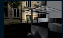
Computer - Modelling